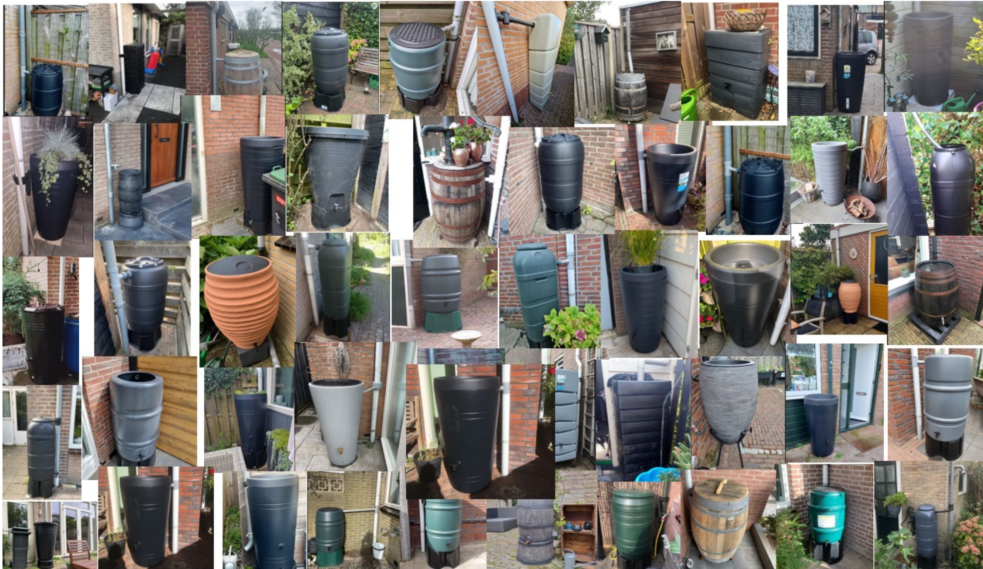
Resultaat regentonactie 2023, 100 aanmeldingen, 50 deelnemers. Bijdrage van 50% tot een max van €70 20% van de Dorpsraad en 50% van de gemeente Uitgeest